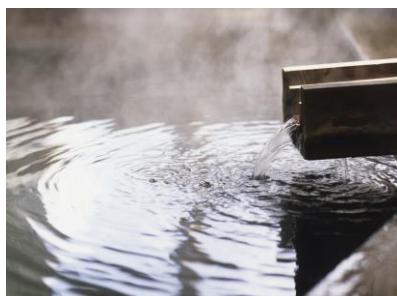
ONSEN KUROKAWA DIA 07 / KUMAMOTO

Visitaremos Uno de los tres mejores paisajes nocturnos de Japón