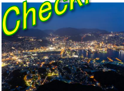
Mt. INASA DIA 05 / NAGASAKI

Visitaremos Uno de los tres mejores paisajes nocturnos de Japón